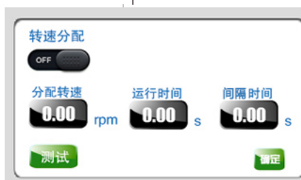
分配转速及间隔时间界面