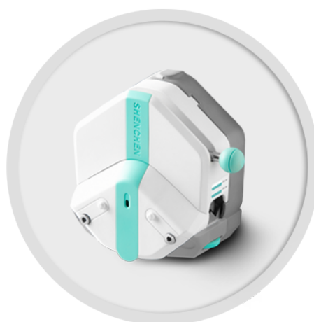
EasyPump 系列 (不可调压)