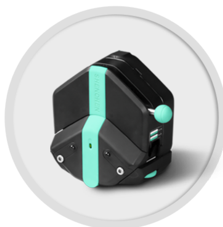
EasyPump-PPS 系列 (不可调压)